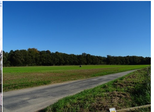
Les abords du monument